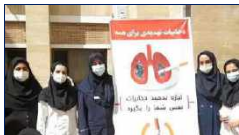
اقدامات مرکز آموزشی، پژوهشی و درمانی کوثر با شعار کاهش و کنترل مصرف دخانیات در هفته سلامت ۱۴۰۱/۰۲/۲۷