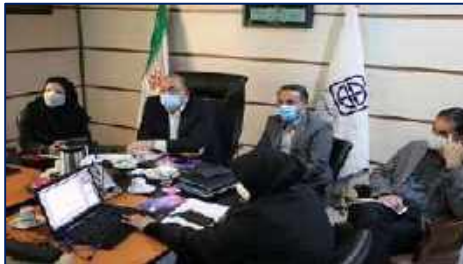
اولین جلسه کارگروه اجرایی دفاتر خدمات سلامت برگزار شد ۱۴۰۱/۰۲/۲۵