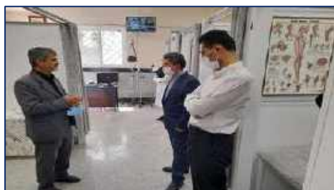
ارائه خدمات فیزیوتراپی در مرکز جدید فیزیوتراپی در شبکه بهداشت و درمان شهرستان سرخه ۱۴۰۱/۰۲/۰۶