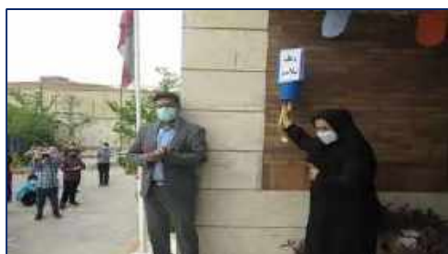
نواختن زنگ سلامت در مدرسه ابتدایی شاهد سمنان توسط ریاست مرکز بهداشت شهرستان سمنان ۱۴۰۱/۰۲/۱۸