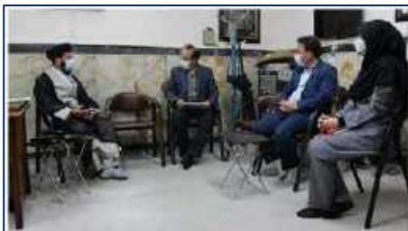
دیدار سرپرست شبکه بهداشت و درمان شهرستان گرمسار با امام جمعه شهرستان به مناسبت هفته سلامت ۱۴۰۱/۰۲/۱۷