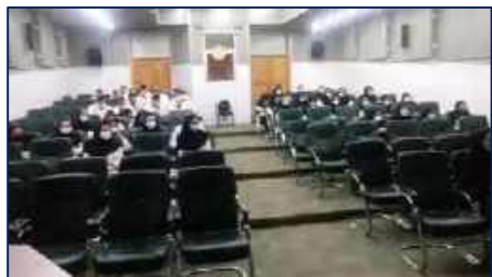
برگزاری کارگاه آموزشی ارتقای سلامت خانواده در مرکز آموزشی، پژوهشی و درمانی امیرالمومنین (ع) ۱۴۰۱/۰۲/۲۴