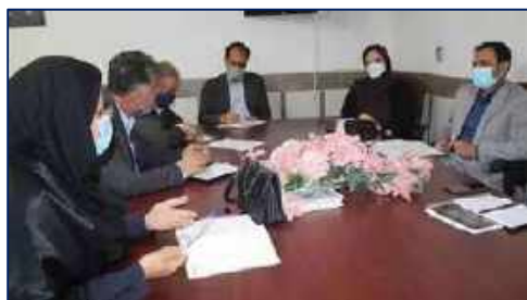
برگزاری جلسه هماهنگی کنترل سالک در بخش امیرآباد شهرستان دامغان ۱۴۰۱/۰۲/۱۱