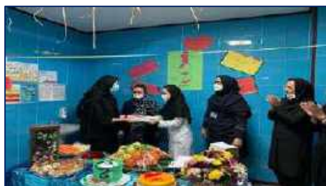
برگزاری جشن گرامیداشت روز ماما ۱۴۰۱ در بیمارستان معتمدی گرمسار ۱۴۰۱/۰۲/۲۰