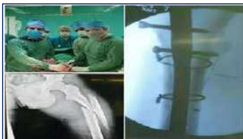
جراحی موفقیت آمیز چهار ساعته جوان ۱۷ ساله در مرکز آموزشی پژوهشی و درمانی کوثر سمنان ۱۴۰۱/۰۲/۲۱