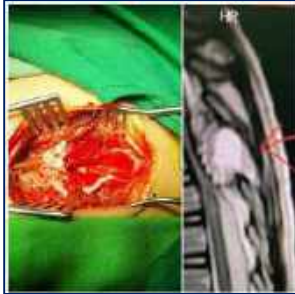
عمل جراحی موفقیت آمیز کودک ۶ ساله با ضعف اندام تحتانی در مرکز آموزشی، پژوهشی و درمانی کوثر ۱۴۰۱/۰۲/۱۱