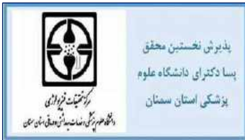
پذیرش نخستین محقق پسا دکتراي در دانشگاه علوم پزشکی استان سمنان ۱۴۰۱/۰۲/۱۸