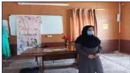
برگزاری جلسه آموزشی به مناسبت هفته جمعیت در مدرسه ۱۵ خرداد سرخه ۱۴۰۱/۰۲/۳۱