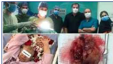
عمل جراحی موفقیت آمیز خارج کردن تومور مغزی در مرکز آموزشی پژوهشی و درمانی کوثر سمنان ۱۴۰۱/۰۲/۲۶