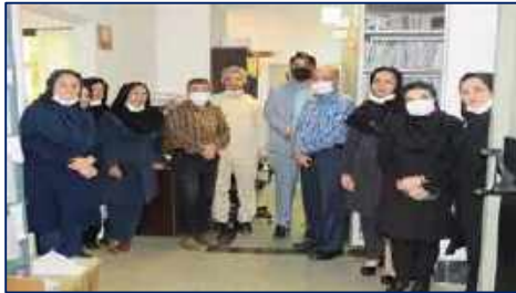
بزرگداشت روز اسناد ملی و مدارک پزشکی در مرکز آموزشی پژوهشی و درمانی کوثر ۱۴۰۱/۰۲/۲۱