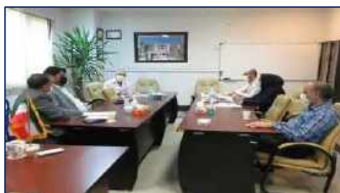
جلسه تجهیزات پزشکی با حضور معاون غذا و دارو و سرپرست اداره تجهیزات پزشکی در بیمارستان کوثر ۱۴۰۱/۰۲/۱۸