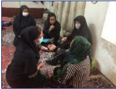
ویزیت سالمندان ناتوان در منزل توسط واحد سلامت خانواده شبکه بهداشت و درمان شهرستان سرخه به مناسبت هفته سلامت ۱۴۰۱/۰۲/۲۱