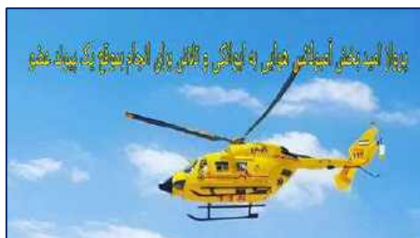
انتقال مصدوم از منطقه کوهستانی لاسجرد به گرمسار توسط پایگاه اورژانس هوایی دانشگاه ۱۴۰۱/۰۲/۲۰