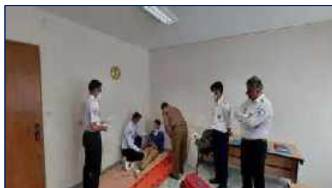
سومين كارگاه آموزشي مديريت پيش بيمارستاني بيماران ترومايي PHTM ۱۴۰۱/۰۲/۲۱