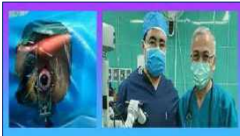
جراحی موفقیت آمیز پارگی وسیع قرنیه چشم در مرکز آموزشی، پژوهشی و درمانی کوثر ۱۴۰۱/۰۲/۲۷