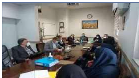
نشست صمیمی با اعضای هیات علمی و دستیاران گروه کودکان ۱۴۰۱/۰۲/۱۰