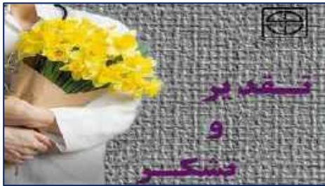
قدردانی جمعی از بیماران از کادر درمان بیمارستان کوثر ۱۴۰۱/۰۲/۲۱