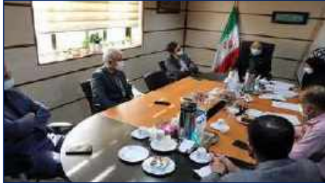
سومین جلسه کمیته بهره‌وری نیروی انسانی در دانشگاه برگزار شد ۱۴۰۱/۰۲/۲۴