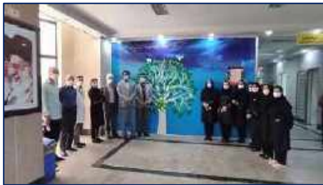
آیین رونمایی از پروژه درخت زندگی به پاسداشت نام و یاد جانبخشان در بیمارستان کوثر سمنان ۱۴۰۱/۰۲/۲۸