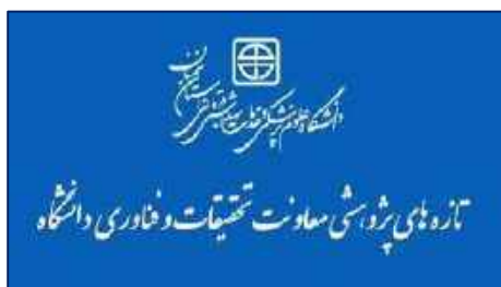
توجه به مشکلات سلامت روان در دانش‌آموزان دوره اول متوسطه دولتی در استان سمنان ضرورت دارد ۱۴۰۱/۰۲/۲۵