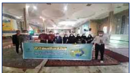
گلباران مزار شهدای شهرستان سرخه به مناسبت هفته سلامت ۱۴۰۱/۰۲/۲۴