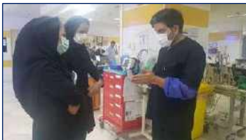
گرامیداشت روز جهانی بهداشت دست در بیمارستان ولایت ۱۴۰۱/۰۲/۱۸