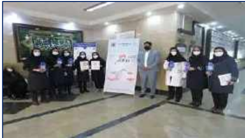
گرامیداشت روز جهانی بهداشت دست در مرکز آموزشی، پژوهشی و درمانی کوثر سمنان ۱۴۰۱/۰۲/۱۸