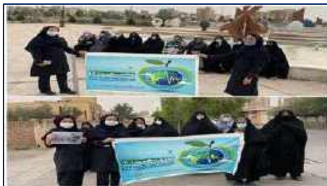
برگزاری همایش پیاده روی و دوستی با طبیعت در مرکز خدمات جامع سلامت شهید نبی اله صفری شهرستان گرمسار ۱۴۰۱/۰۲/۲۱