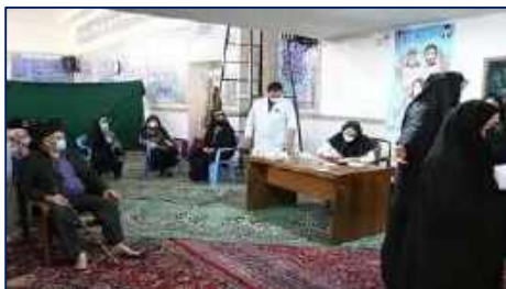
اقدامات تیم شهید رهنمون بسیج جامعه پزشکی بیمارستان کوثر سمنان در هفته رزمایش جهادگران فاطمی ۱۴۰۱/۰۲/۲۴