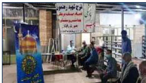
تیم شهید رهنمون بسیج جامعه پزشکی مرکز آموزشی، پژوهشی درمانی امیرالمومنین (ع) در هفته رزمایش جهادگران فاطمی ۱۴۰۱/۰۲/۲۱