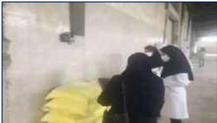
بازدید بازرسان معاونت غذا و دارو دانشگاه علوم پزشکی از کارخانه آرد سمنان ۱۴۰۱/۰۲/۱۲