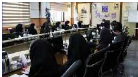
نشست رئیس و اعضای هیات علمی دانشکده دندانپزشکی با ریاست دانشگاه علوم پزشکی استان سمنان ۱۴۰۱/۰۲/۲۵