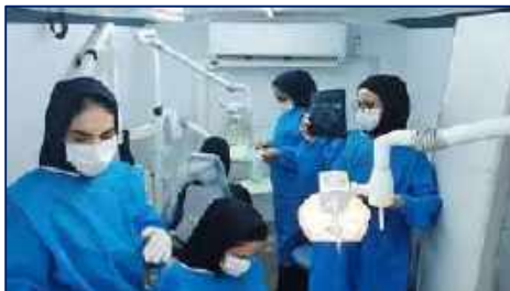
اردوی جهادی اتوبوس سیار دندانپزشکی به مناطق کم‌برخوردار در هفته سلامت ۱۴۰۱/۰۲/۲۵