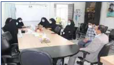
برگزاری جلسه هماهنگی درون بخشی هفته سلامت در شبکه بهداشت و درمان دامغان ۱۴۰۱/۰۲/۱۵