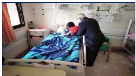
ورود پرچم مطهر حرم دو امام همام به بیمارستان ولایت دامغان ۱۴۰۱/۰۲/۲۴