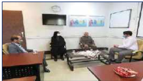
دیدار مدیر کانون خدمت تخصصی سلامت رضوی استان سمنان با سرپرست بیمارستان کوثر ۱۴۰۱/۰۲/۲۸