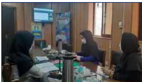
برگزاری کارگاه کشوری شش روزه آموزش پرسشگران دومین پیمایش ملی سلامت روان ۱۴۰۱/۰۲/۲۵