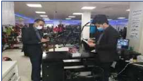
گشت مشترک بازرسان معاونت غذا و دارو از باشگاه های بدنسازی شهرستان سمنان ۱۴۰۱/۰۲/۲۱