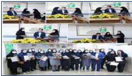
برگزاری مراسم گرامیداشت روز جهانی ماما در شبکه بهداشت و درمان شهرستان گرمسار ۱۴۰۱/۰۲/۲۱