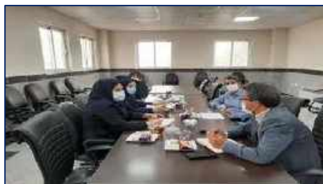
برگزاری جلسه هماهنگی سمن ها به مناسبت هفته سلامت در شبکه بهداشت و درمان سرخه ۱۴۰۱/۰۲/۲۰