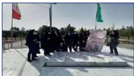
برگزاری همایش پیاده روی بانوان شبکه بهداشت و درمان دامغان و سایر ادارات این شهرستان به مناسبت گرامیداشت هفته ملی جمعیت ۱۴۰۱/۰۲/۳۱