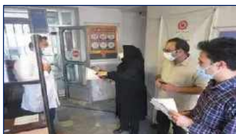
ریاست مرکز بهداشت شهرستان سمنان با شاخه های گل به دیدار همکاران رفت ۱۴۰۱/۰۲/۱۸