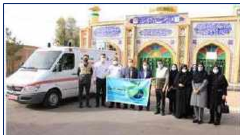
تجدید میثاق با شهدا در اولین روز هفته سلامت در شهرستان گرمسار ۱۴۰۱/۰۲/۱۷