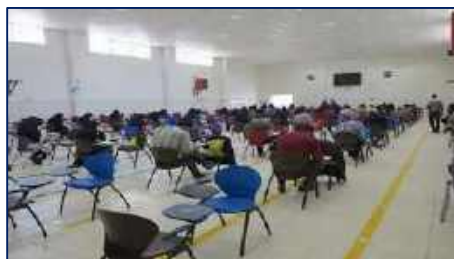
چهل و نهمین دوره آزمون پذیرش دستیار تخصصی بالینی برگزار شد ۱۴۰۱/۰۲/۲۴