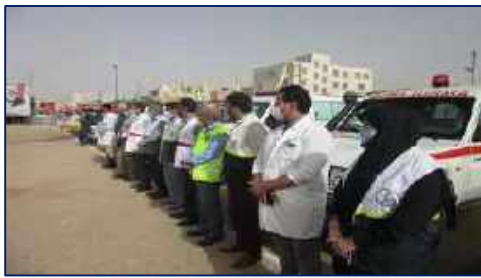
حضور اعضای کانون بسیج جامعه پزشکی مرکز بهداشت سمنان در مراسم رزمایش جهادگران فاطمی ۱۴۰۱/۰۲/۱۸