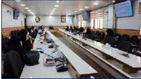
نشست صمیمی مشاور ریاست دانشگاه در امور بانوان با نماینده های واحدهای تحت پوشش دانشگاه ۱۴۰۱/۰۲/۲۷