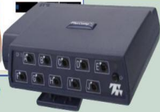
FlexComp and ProComp Infiniti™ are at the heart of the Sports Science of Milan Lab at A.C. Milan