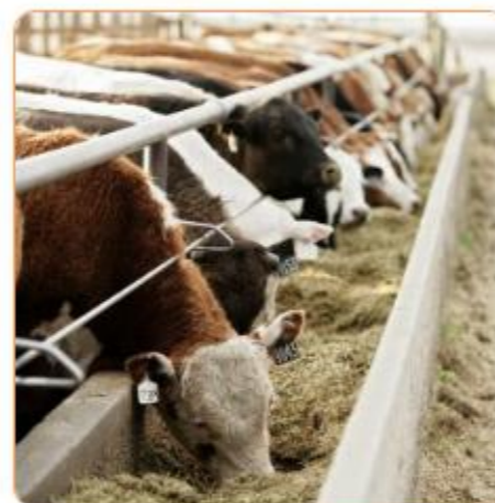
تحلیل داده‌های ژنتیکی برای دامداری هوشمند