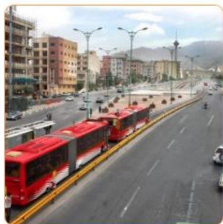
استخراج سیکل رانندگی اتوبوس‌های شهر تهران