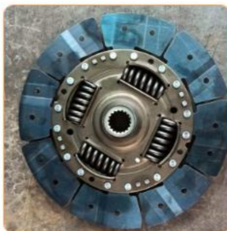
تحلیل رفتار نیرویی قطعه بالشتک (cushion)