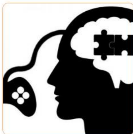
ارزیابی مهارت‌های نرم متقاضیان استخدام براساس خروجی آنها در بازی‌های شناختی آنلاین