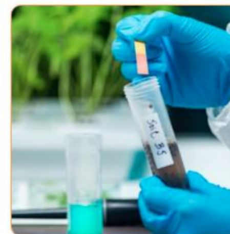
تحقیق و توسعه کودهای ترکیبی npk